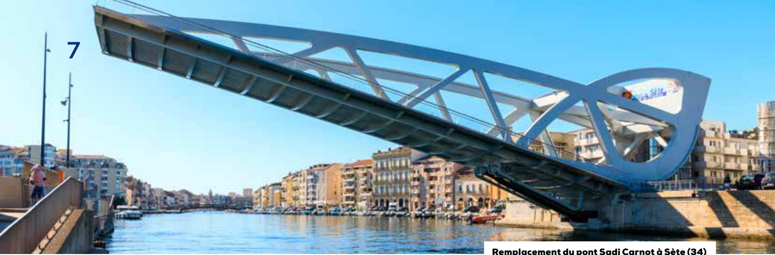
Remplacement du pont Sadi Carnot à Sète (34)