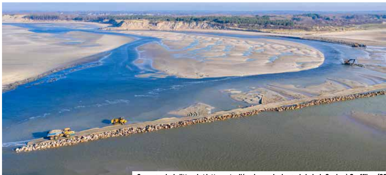
Sauvegarde du littoral et lutte contre l'érosion sur le rivage du bois de Sapins à Groffliers (62)