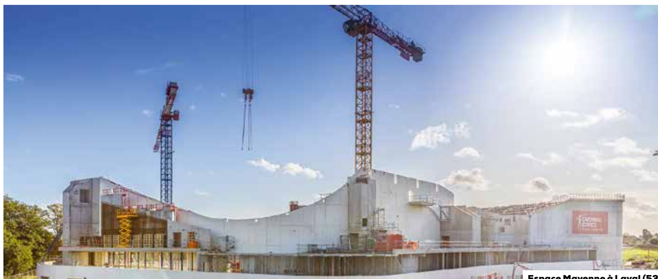
Espace Mayenne à Laval (53)