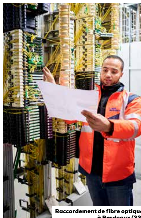
Raccordement de fibre optique à Bordeaux (33)