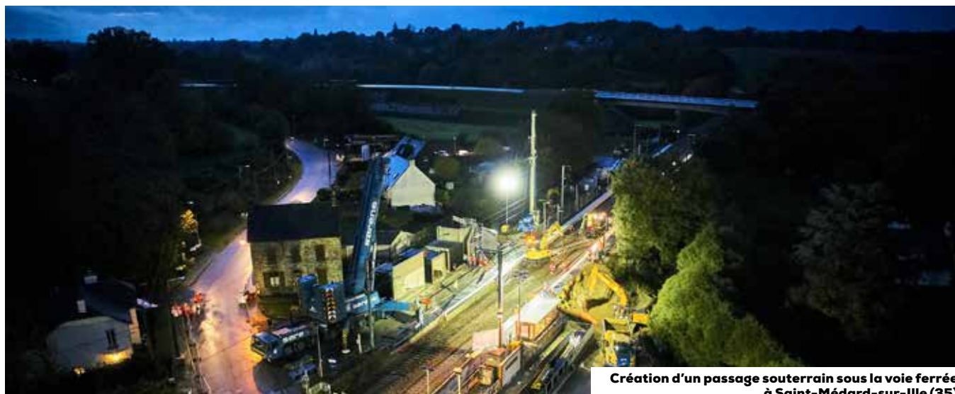
Création d'un passage souterrain sous la voie ferrée à Saint-Médard-sur-Ille (35)

Il n'existe pas au 31/12/2019 de quote-part des autres éléments de résultat global des entreprises associées et des coentreprises comptabilisées selon la méthode de la mise en équivalence