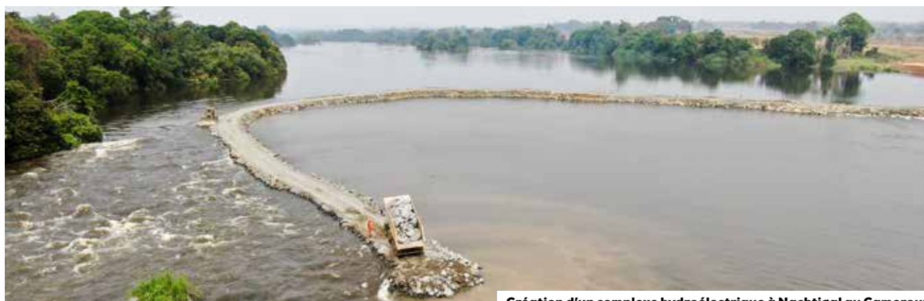
Création d'un complexe hydroélectrique à Nachtigal au Cameroun