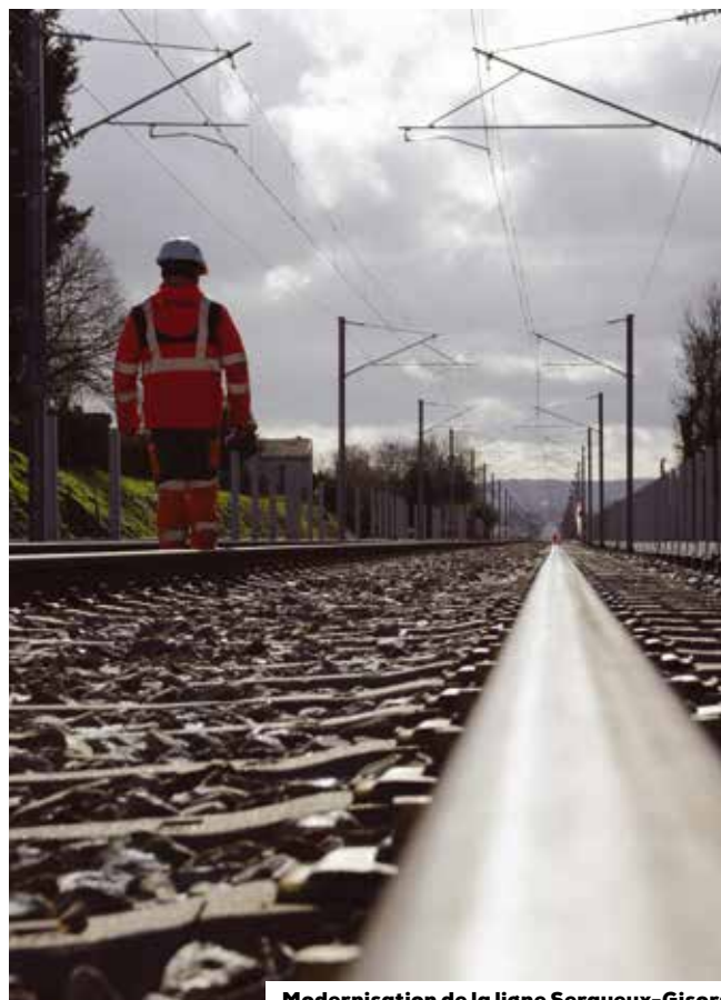
Modernisation de la ligne Serqueux-Gisors