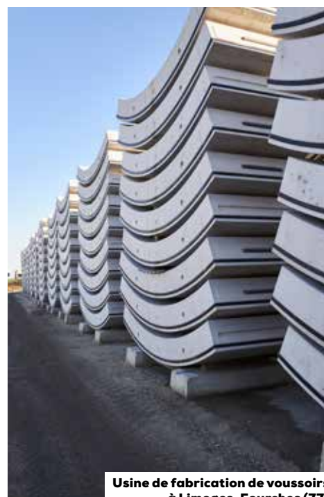
Usine de fabrication de voussoirs à Limoges-Fourches (77)