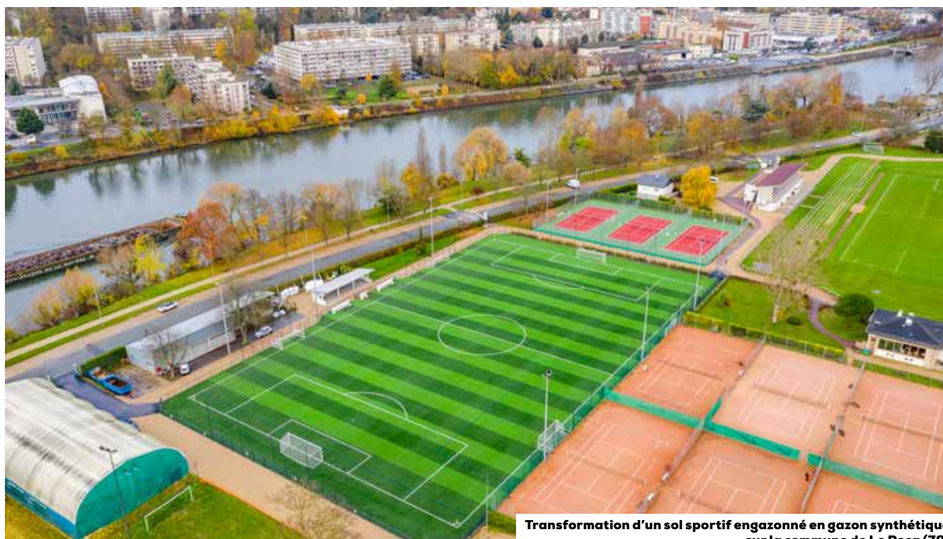
Transformation d'un sol sportif engazonné en gazon synthétique sur la commune de Le Pecq (78)