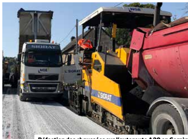
Réfection des chaussées sur l'autoroute A20 en Corrèze

La valeur nette de ces contrats de location-financement s'élevait au 1 er Janvier 2019 à 125 millions d'euros, et, le détail est présenté en note 8.3 ci-dessous.