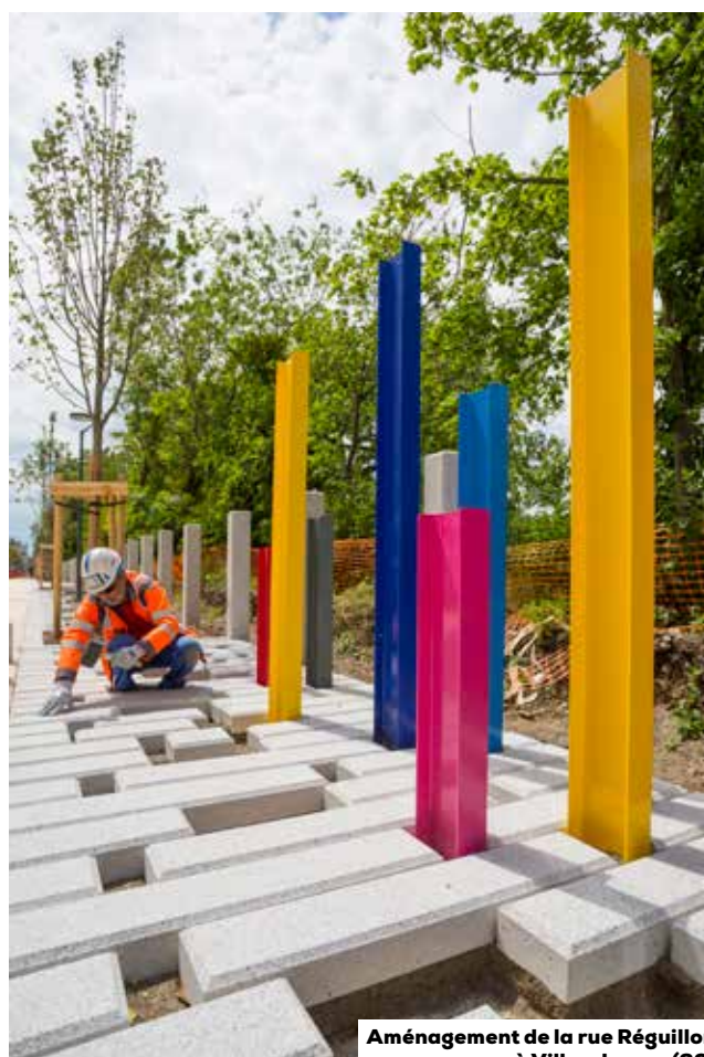
Aménagement de la rue Régillon à Villeurbanne (69)