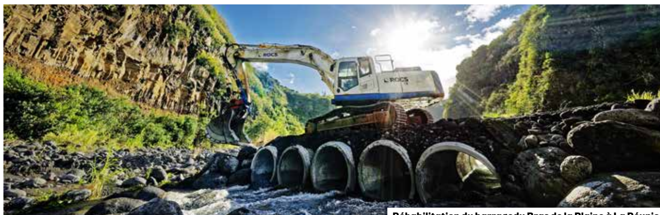
Réhabilitation du barrage du Bras de la Plaine à La Réunion