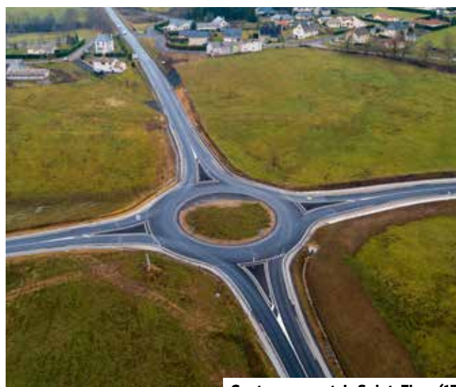
Contournement de Saint-Flour (15)

Les soldes d'impôts différés sont déterminés sur la base de la situation fiscale de chaque entité ou du résultat d'ensemble des entités comprises dans le périmètre d'intégration fiscale, et sont présentés à l'actif ou au passif du bilan pour leur position nette par entité fiscale.